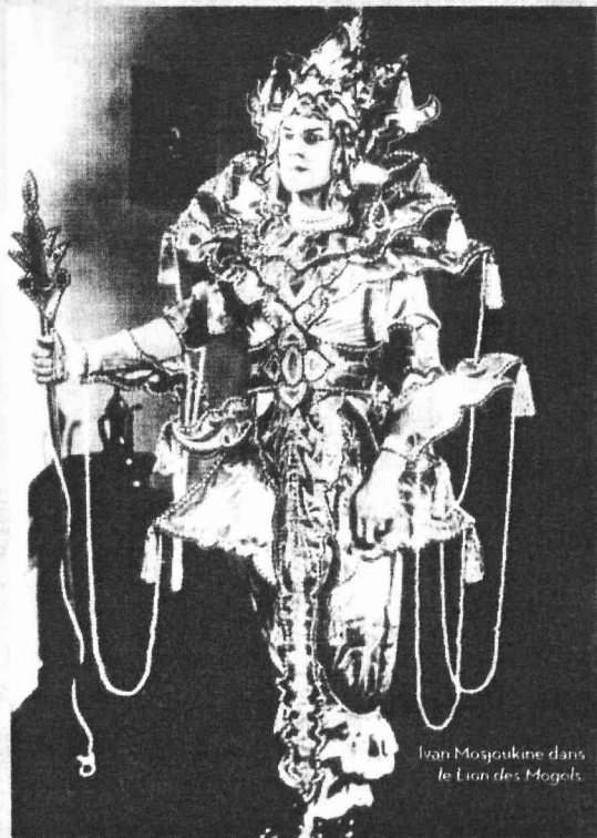
Ivan Mosjoukine dans Le Lion des Mogols .