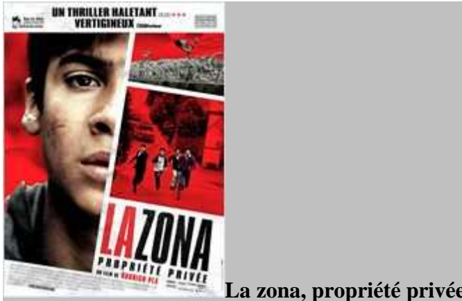
La zona, propriété privée

Lundi 18/10 19h30 : "La Zona, propriété privée"