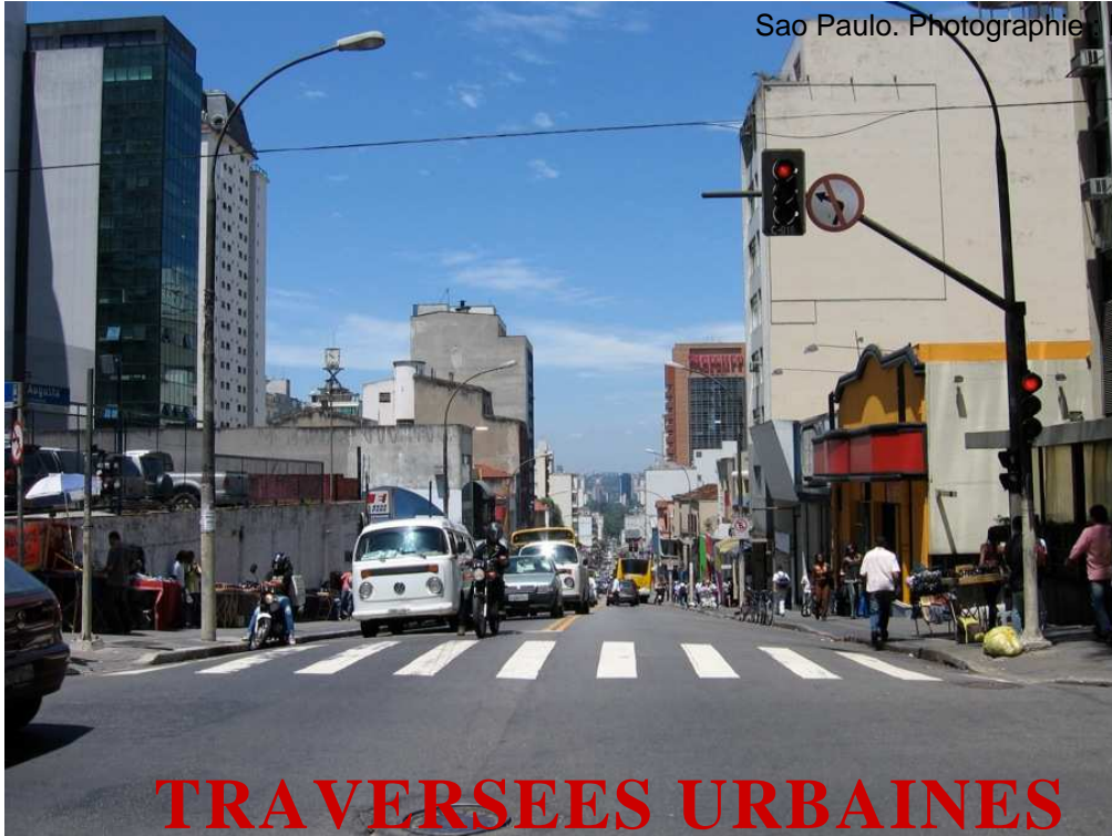
Sao Paulo.