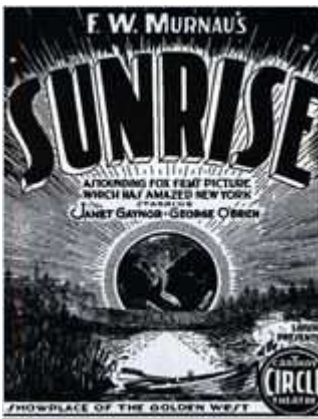
L'aurore - Sunrise : a song of two humans

Un film américain de F.W. Murnau de 1927