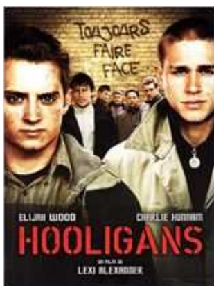
Green Street hooligan

Un film américano-britannique de Lexi Alexander 2005 Avec Elijah Wood, Charlie Hunnam, Claire Forlani