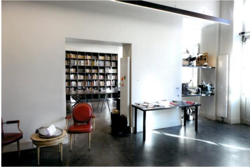
La Cinémathèque de Grenoble et son nouveau centre de documentation.

En 2014, les locaux de la Cinémathèque, rue Hector Berlioz, ont été complètement rénovés, permettant l'accueil du public trois après-midi par semaine (ou sur rendez-vous) depuis leur réouverture en janvier dernier. La Cinémathèque devient ainsi un lieu de recherche et de lecture mais aussi un espace de visionnage, ouvert aux professionnels du cinéma comme aux cinéphiles, chercheurs ou simples amateurs.